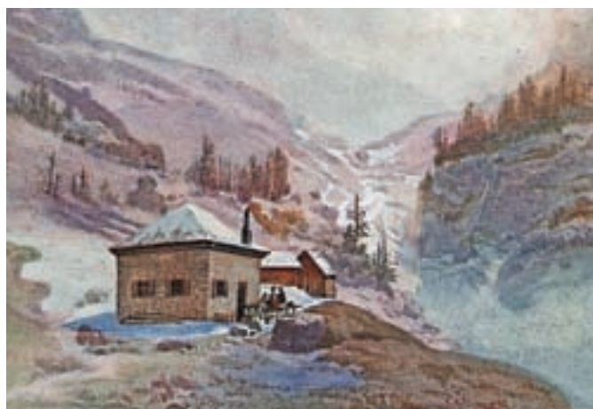
Prva planinska kočica Friskaufova v Suhem Dolu nad Suhadolnikom 1876