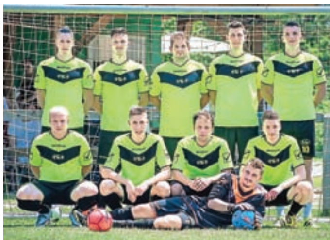
Skupinska slika ekipe Gostišče ob Planšarskem jezeru Jezersko

Za udejstvovanje jezerskih nogometašev na turnirjih pa nam očitno tudi v prihodnosti ni treba skrbeti. Kar 10–15 otrok se udeležuje treningov nogometa, ki potekajo na Jezerskem. Zaradi neprimernosti treniranja na asfaltni podlagi se je pojavi-